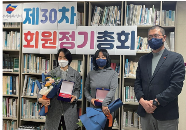
회원 정기총회 갈무리

"올해도 한라생태학교 하나요?" 언제나 문이 쏠리지 않는 한라생태길라잡이 쌤들의 각종 활동이 코로나19 상황으로 난관에 부딪히고, 청소년 친구들과 함께했던 '안드럼을 만나러 가는 길'도 진행이 어려워 아쉬움이 많았던 2020년을 보낸 우리 길라잡이 쌤들, 그러나 올해는 비대면 방식의 생태캠프를 기획하는 등 그 누구보다 힘찬 도약의 한해를 준비하고 계시다는 소문이 들려 옵니다! 올해도 우리 쌤들의 아름다운 활약, 매우 기대됩니다!~