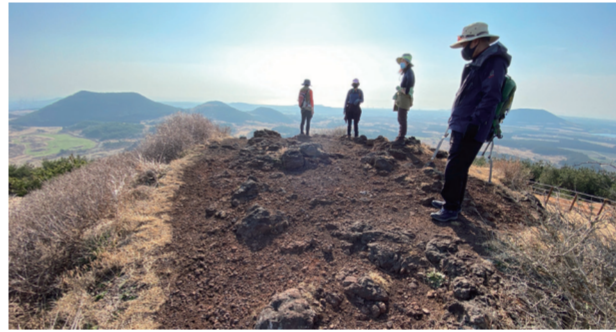
생태문화해설가모임 올레 in 2021

2월 15,16,17일 제2공항의 운명을 결정할 도민 여론조사가 진행되었습니다. 도의회 제2공항강행특위와 제주도정 진통 끝에 마련한 운명의 여론조사. 제주를 지키겠다는 마음으로, 더 이상 난개발과 국제자유도시의 가속화를 두고 볼 수 없다는 마음으로 우리 단체 활동가들은 회원들과 힘을 합쳐 제2공항 반대를 알리기 위한 피케팅을 매일매일 이어갔습니다. 여론조사 결과는 "제2공항 반대". 이제 국토부의 제2공항 백지화 선언과 공동체 회복을 위해 모두의 노력을 이어갈 일만 남았습니다.