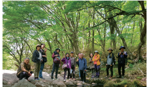
한라생태길라잡이 in 2021

물참오름, 문석이름, 도너리오름, 송악산에 이어, 올해는 용눈이오름과 백악이오름 정상부가 휴식년제에 들어갔다는 사실, 알고 계신가요? 한 달에 한 번씩 휴식년 오름에 올라 훼손 지점의 상태를 관찰하고, 대안을 모색하는 활동을 이어오고 있는 우리 올레 쌤들, 올해도 멋진 활약이 이어진다는 반가운 소식입니다. 얼른 코로나19 상황이 종식되어 우리 쌤들의 환경교육도 원활히 이뤄지길 바라며, 2021년 쌤들의 유쾌한 활약을 응원합니다. +.+