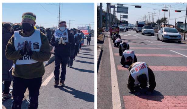
제2공항 백지화를 위한 삼보일배(2/4-9)

드림타워로 카지노가 이전되면, 국내 최대규모의 도박장이 주거지역 한복판에 들어오는 전 세계적으로도 유례없는 선례를 남기게 됩니다. 도민 삶의 질은 떨어질 것이고, 영업이 어려워지면 내국인 카지노에 대한 압박도 배제할 수 없습니다. 영업이 잘 된다면? 나머지 6개의 소규모 카지노들도 왔다 뒤 도심 한복판에 초대형 도박장을 허가해 달라고 요청할 것입니다. 도민사회의 재앙이 될 드림타워 카지노 이전 문제, 지난 2월 23일에는 도의회 의원들의 카지노 현장답사가 진행되었는데, 이에 맞춰 우리 단체 활동가들은 도의회 앞에서 카지노 이전 불허를 촉구하는 피케팅을 진행했습니다. '의원님, 아이들의 학습권과 주민들의 삶의 질은 외면하실 겁니까?'