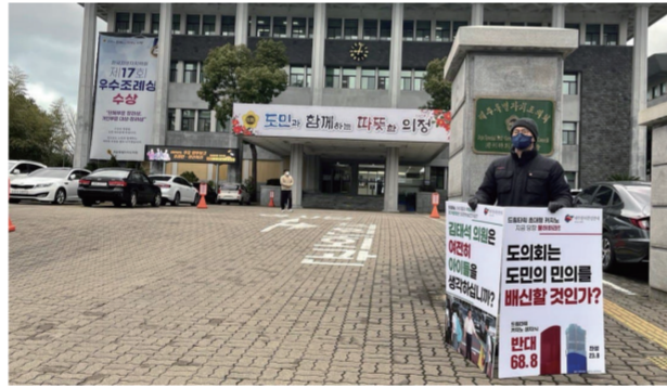
드림타워 카지노 불허 촉구 피케팅(2/23)

드림타워로 카지노가 이전되면, 국내 최대규모의 도박장이 주거지역 한복판에 들어오는 전 세계적으로도 유례없는 선례를 남기게 됩니다. 도민 삶의 질은 떨어질 것이고, 영업이 어려워지면 내국인 카지노에 대한 압박도 배제할 수 없습니다. 영업이 잘 된다면? 나머지 6개의 소규모 카지노들도 왔다 뒤 도심 한복판에 초대형 도박장을 허가해 달라고 요청할 것입니다. 도민사회의 재앙이 될 드림타워 카지노 이전 문제, 지난 2월 23일에는 도의회 의원들의 카지노 현장답사가 진행되었는데, 이에 맞춰 우리 단체 활동가들은 도의회 앞에서 카지노 이전 불허를 촉구하는 피케팅을 진행했습니다. '의원님, 아이들의 학습권과 주민들의 삶의 질은 외면하실 겁니까?'